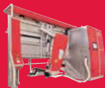
Lely Astronaut A5